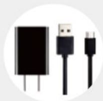
Charger and Data cable